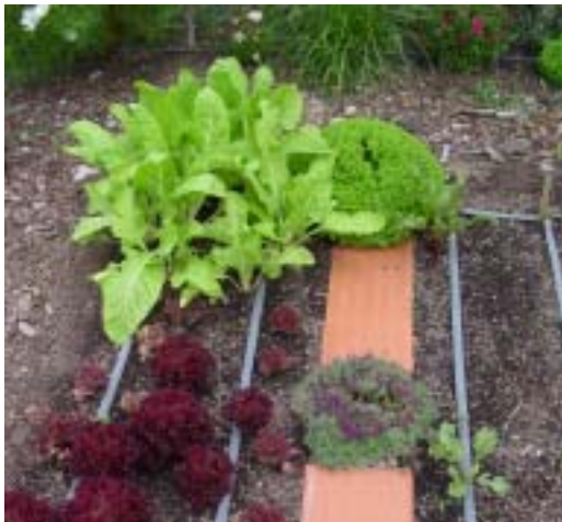
Las bovedillas sirven para no estropear el crestall, para albergar animales beneficiosos y entre ellas permite cultivar plantas aromáticas,

Dado que cada parada tiene dos franjas de cultivo, a parte del corredor central con las piedras planas y las plantas aromáticas, la organización del cultivo es que en cada franja se siembre una variedad hortícola concreta. Lo importante del método es mantener la regla de familias. Las solanaceas (tomates, pimientos, berenjenas, etc.) van siempre solas ocupando toda la parada. Las umbelíferas (zanahorias, apio, apio-rábano, etc.) pueden cultivarse con liliaceas (cebo-