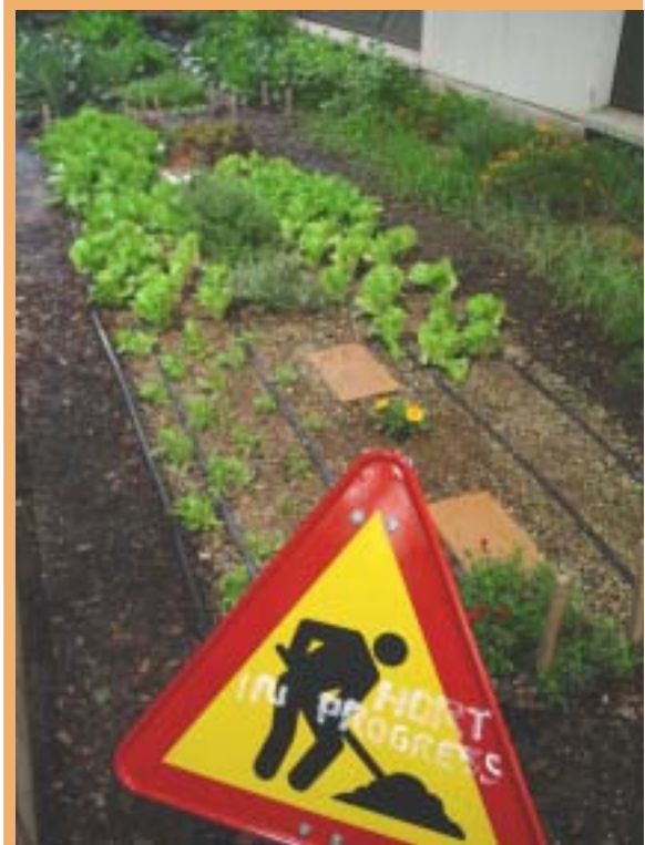
Parada en crestall completa

Dada la vital importancia de la horticultura para muchas familias, especialmente en países donde la agricultura familiar es esencial para su supervivencia hemos elaborado un documento en formato PDF de libre distribución basado en nuestra experiencia para que cualquiera pueda adoptar el método. Para cualquier consulta sobre el método contactar con www.culturadecamp.org .